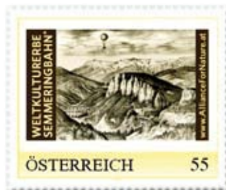
Auch mit anderen Motiven weiß die Gruppe für ihr politisches Engagement zu werben.

auch das ist nicht erst- und einmalig, wengleich auf einer Briefmarke seltener zu finden, nimmt man die entsetzlichen Beispiele unsäglicher deutscher Vergangenheitsgeschichte aus. Kunst war auf jeden Fall zu keiner Zeit unpolitisch und dieses Schicksal teilt sie mit der Briefmarke.