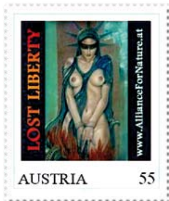
Die Briefmarke mit der „Lost Liberty“ erschien bereits im Dezember 2007

denn das Bild, urheberrechtlich von der Gruppe geschützt, ist nicht nur auf der erwähnten Briefmarke, sondern auch als Gemälde auf Leinen, als Poster und Aquarell auf Papier erhältlich. Neben diesem Motiv gibt es auch zahllose andere ansprechende Gemälde, die von namhaften und bekannten Künstlern wie Arik Brauer, Ernst Fuchs, Helmut Kies, Gottfried Kumpf, Karl Goldammer und Jonathon Roberts geschaffen wurden. Sie unterstützen ALLIANCE FOR NATURE, indem sie zu den einzelnen Natur- und Kulturschutz-Initiativen Kunstwerke schaffen. Aus dem Verkaufserlös werden u.a. die Welterbe-Initiativen finanziert (z.B. „Weltkulturerbe Semmeringbahn“, „Welterbe Wachau“).