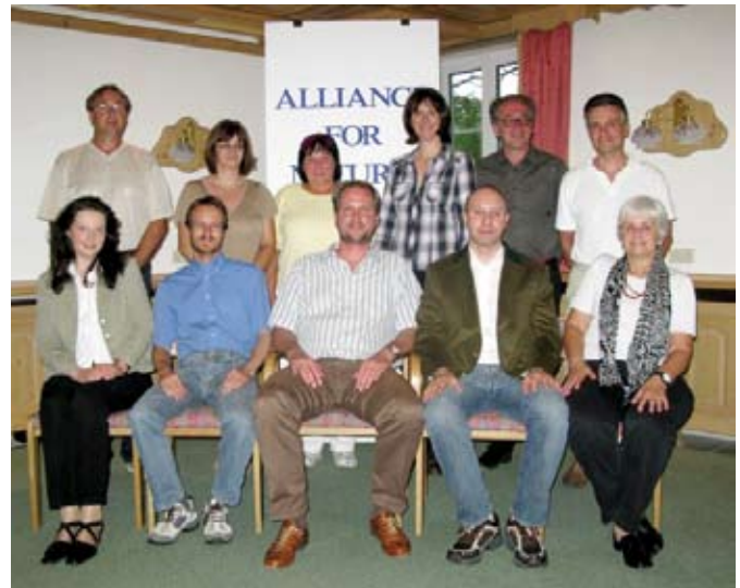
Das Team der Alliance for Nature bei der letzten Jahresversammlung 2008.

statue vor New York. Liberty als weibliche, sehr weibliche Inkarnation der Freiheit, des höchsten Guts und der Hoffnung für Millionen Menschen auf ein besseres neues Leben in einer neuen Welt.