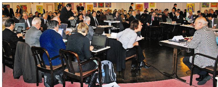
Bis auf den letzten Platz gefüllt war der Veranstaltungssaal.

Alleine für die einführenden Worte benötigte Verhandlungs-