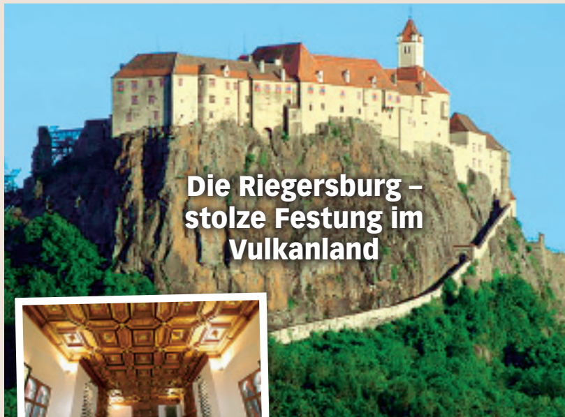
Die Riegersburg – stolze Festung im Vulkanland

Zu erreichen ist die Riegersburg entweder zu Fuß über den von Jahrhunderten gezeichneten, malerischen Weg durch die Burgtore und entlang der Befestigungsmauern oder über den Schrägaufzug auf der Nordseite der Burg. Geöffnet: September tägl. 9–17 Uhr, Oktober tägl. 10–17 Uhr. Preise: € 10,-, Ermäßigung für Senioren, Familienkarte. Tel.: 03153/82131 oder www.veste-riegersburg.at