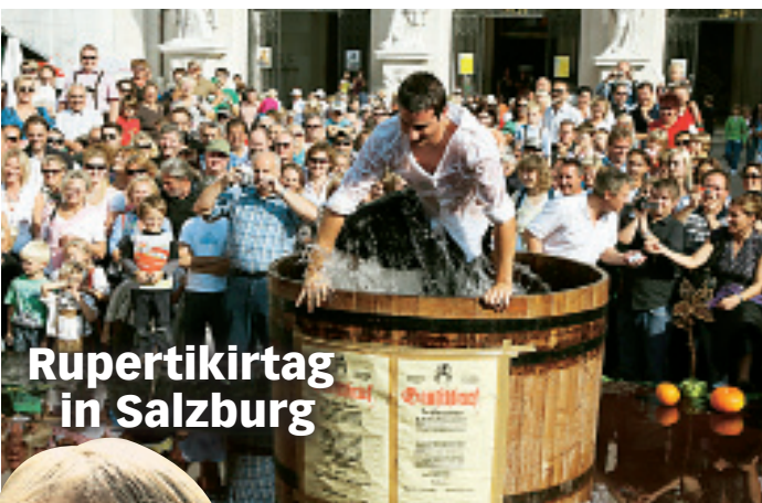
Rupertikirtag in Salzburg

Antworten: 1. 1913-2004 2. 1083 3. In Salzburg