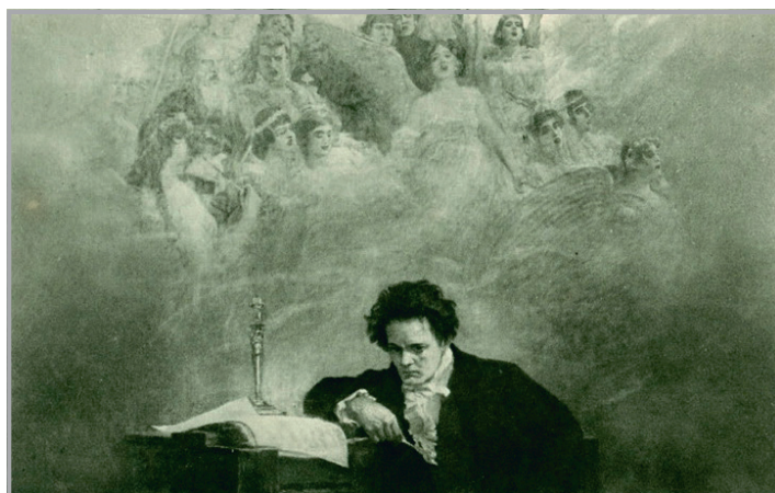
„Allzeit habe ich mich zu den größten Verehrern Mozarts gerechnet und werde es bis zum letzten Lebenshauch bleiben.“ (Ludwig van Beethoven)

Zurückgezogen und fast schon vereinsamt sowie gereizt durch diese zunehmende Behinderung, schrieb er im Juni 1800 seinem Jugendfreund Franz Gerhard Wegeler: „(...) mein Gehör ist seit 3 Jahren immer schwächer geworden (...) diesen Winter ging es mir wirklich elend (...) meine Ohren, die sausen und brausen Tag und Nacht fort; ich kann sagen, ich bringe mein Leben elend zu, seit 2 Jahren fast meide ich alle Gesellschaften, weil's mir nun nicht möglich ist, den Leuten zu sagen, ich bin taub (...) in meinem Fache ist das ein schrecklicher Zustand, dabey meine Feinde, deren Anzahl nicht geringe ist, was würden diese hiezu sagen (...) Ich habe schon oft mein Schicksal verflucht; Plutarch hat mich zu dieser Resignation geführt; ich will, wenn's anders möglich ist, meinem Schicksal trotzen, obschon es Augenblicke meines Lebens geben wird, wo ich das unglücklichste Geschöpf Gottes sein werde (...)“