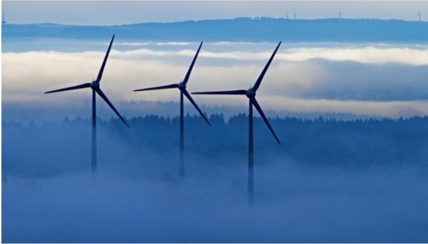
Sorgt auch in der Steiermark unaufhörlich für Diskussionsstoff: Windkraft als Energiequelle.

Vier Jahre lang waren an die 30 Sachverständige mit der Umweltverträglichkeitsprüfung (UVP) für den Windpark Stanglalm in den Fischbacher Alpen beschäftigt. Nun dürfen sich die Konsenswerber freuen: Die neun beantragten Windräder wurden genehmigt. Auch die Windpark-Erweiterung auf der Pretul ist durch.